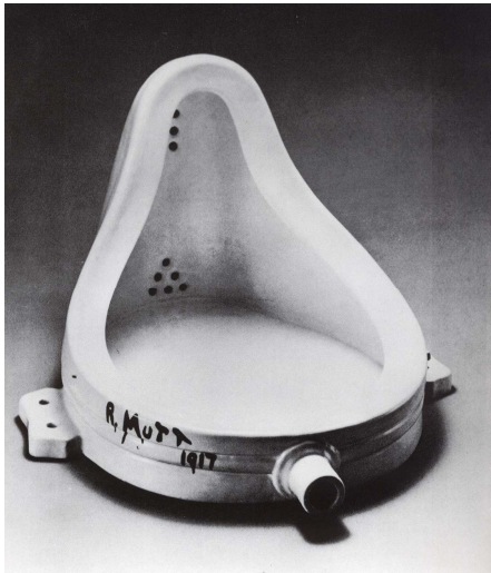
Marcel-Duchamp A Fonte

Sobre a FIGURA 1 , julgue os itens a seguir: