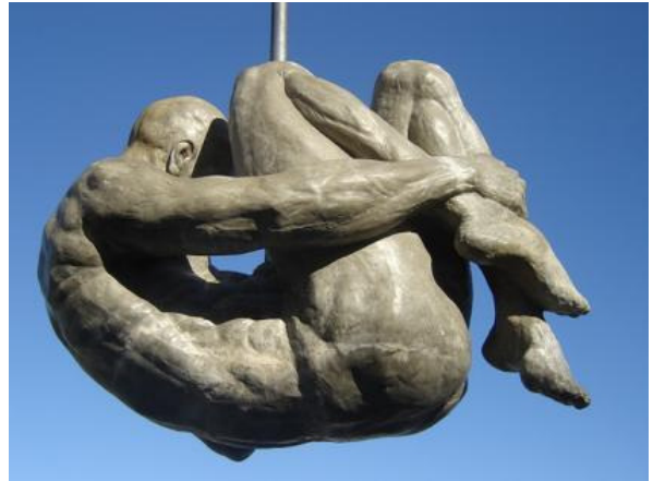
Monumento Tortura Nunca Mais

A Corte Interamericana de Direitos Humanos acaba de notificar o Brasil sobre a sentença do tribunal a respeito do processo movido pelos familiares dos guerrilheiros desaparecidos no Araguaia. Em comunicado, a corte diz que "com base no direito internacional e em sua jurisprudência constante, a Corte Interamericana concluiu que as disposições da Lei de Anistia que impedem a investigação e sanção de graves violações de direitos humanos são incompatíveis com a convenção americana e carecem de efeitos jurídicos, razão pela qual não podem continuar representando um obstáculo para a investigação dos fatos do caso, nem para a identificação e punição dos responsáveis".